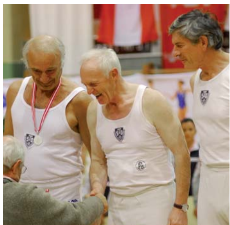
Turn10: Spaß am Turnen in allen Altersstufen.

Die TS Göfis stellte nicht nur eine besonders große Delegation, der Verein führte auch mit zwei Siegen und einer Silbermedaille auch die Medaillenstatistik der VTS vor der SG Götzis (1/1/1) an. Weitere Siege gingen ans TSZ Dornbirn und die TS Bregenz Vorkloster.