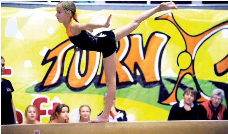
Die Vorarlberger Turnerschaft war bei den zweiten Bundesmeisterschaften in Schwaz mit 31 Teams in der Jugendklasse, zwei Erwachsenen und drei Generationenmannschaften vertreten.

Die TS Schwaz organisierte die diesjährigen ÖFT-Bundesmeisterschaften, die zum zweiten Mal nach dem Turn10-Programm ausgetragen wurden.