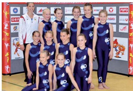
Die VTS-Teams in Rif, oben von links: TSZ Dornbirn Schülerinnenklasse, Nachwuchsklasse, Juniorinnenstufe und Team-Turn10 sowie die TS Wolfurt Meisterklasse und TS Hohenems Jugend.

nauf zu optimalen Doppelsalti mit Schrauben. In Serien von jeweils sechs Athlet/innen direkt hintereinander boten die Teams dynamische Akrobatik. Im bewussten Kontrast dazu standen vor der mit tausend Zuschauern ausverkauften Tribüne die stilvollen und hoch komplexen Darbietungen auf