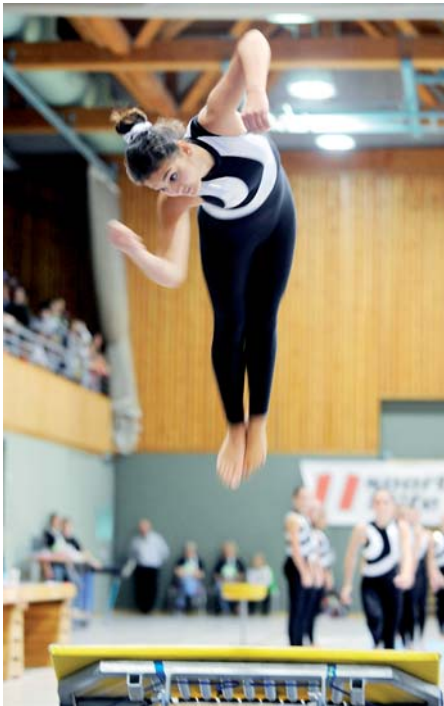
Die siegreichen Dornbirner Juniorinnen bei ihrer rasanten Übung am Minitrampolin.

der Bodenfläche, die mit künstlerischer Note choreografiert und umgesetzt werden. An der führenden Position des TSZ auch für die Zukunft zweifelt niemand: Der Verein gewann neben dem Staatsmeistertitel außerdem vier weitere Titel, die TS Hohenems siegte in der Jugendklasse.