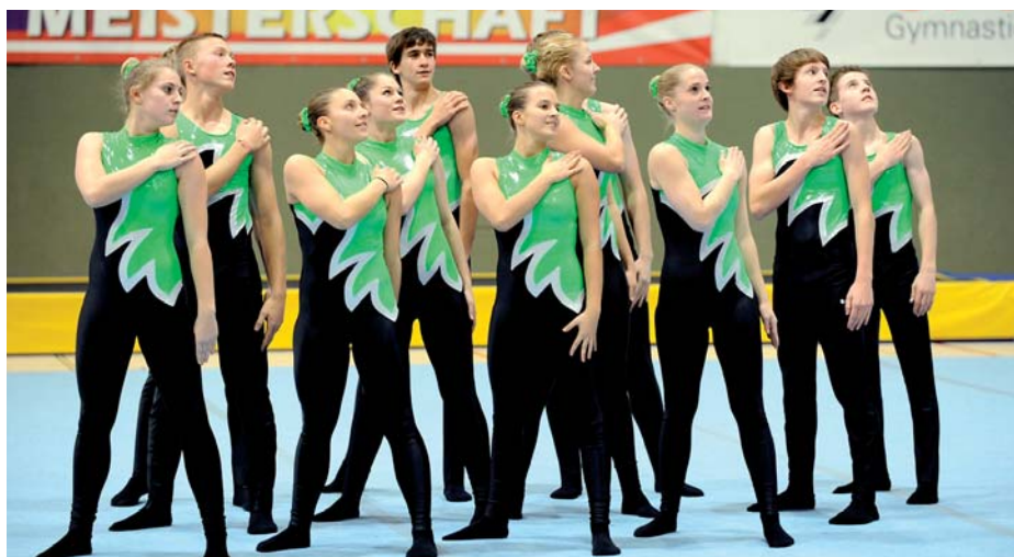
Mit drei jeweils zweitplatzierten Mannschaften (hier die Meisterklasse/mixed) präsentierte sich auch die TS Wolfurt einmal mehr als Verein mit breiter und erfolgreicher Arbeit im Team-Turnen.