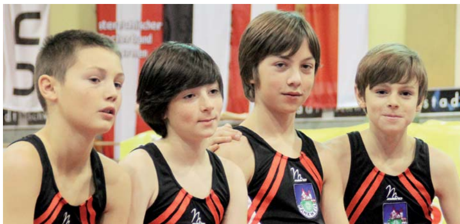
Die Turnerschaft Rankweil freute sich in Schwaz über eine Silber- und eine Bronzemedaille.