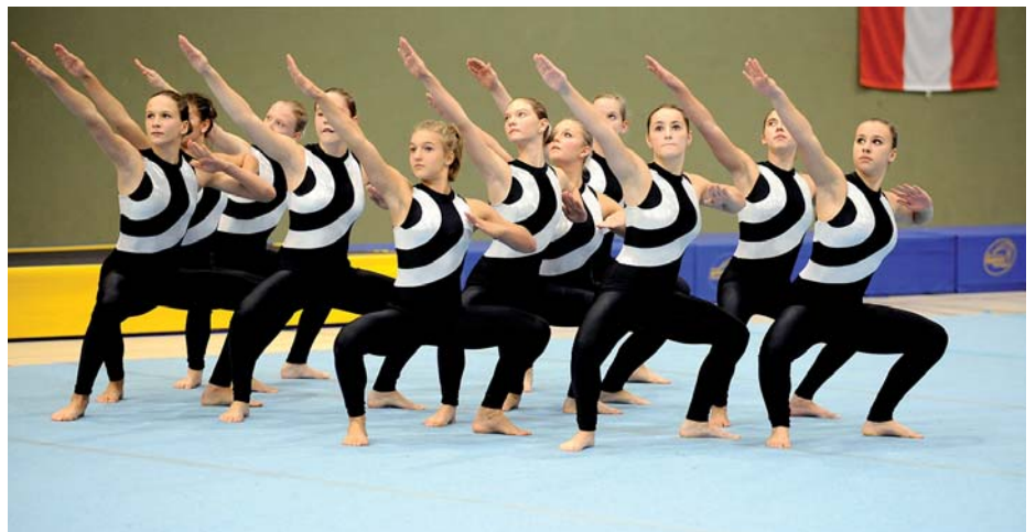
Der Nachwuchs ist gesichert: Die Vorarlberger Vereine waren in den Juniorenstufen stark vertreten (hier die siegreichen Dornbirner Juniorinnen), sodass keine Lücken in den Teams entstehen.