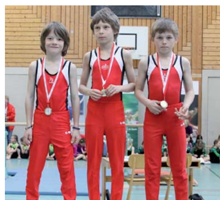
Die Sieger der AK10 vom TSZ Dornbirn.

Am großen Breitturnbewerb mit den Geräten Boden, Barren/Balken, Sprung, Reck und Trampolin beteiligten sich 560 Teilnehmer/innen aus 22 Vereinen. Die Medaillenstatistik wird vom Turnsportzentrum Dornbirn mit drei Goldmedaillen, einmal Silber und einmal Bronze angeführt, es folgen die TS Lustenau mit drei Mal Gold sowie die TS Göfis (2/4/0). Besonders stark vertreten waren die Vereine TS Egg mit 51 Aktiven sowie TSZ Dornbirn, TS Göfis und TS Rankweil mit je 44 Teilnehmer/innen.