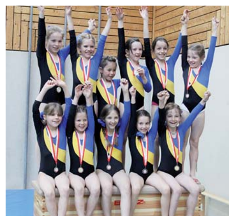
Jubel bei der TS Hard: Der Verein holte eine Gold- und eine Silbermedaille.

Die TS Wolfurt hatte die Turn10-Wettkämpfe erstmals auf zwei Tage verteilt um den hohen Teilnehmerzahlen gerecht zu werden. Allerdings erwies sich das Wochenende mit dem Palmsonntag als Termin, der für einige Vereine nicht ideal war. Die Bundesmeisterschaft im Turn10 findet am 19. November in Schwaz (Tirol) statt.