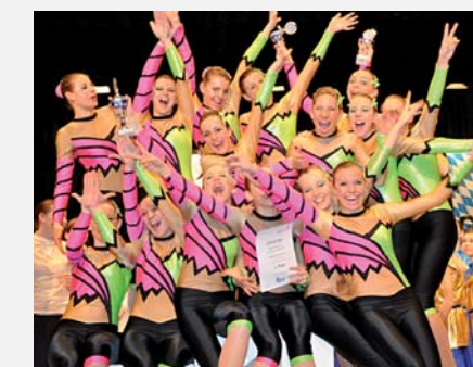
Die TS Schlins feierte mit der Showtanzgruppe schöne Erfolge. Aufgrund der prekären Hallensituation musste leider das Kunstturntraining eingestellt werden.

Bei den Österreichischen Meisterschaften im Showdance Anfang April in Linz holte sich die Turnerschaft Schlins sechs Meistertitel und erreichte damit bei allen Tänzen die Euro-Qualifikation.