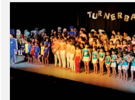
Der Turnerball war zwei Mal ausverkauft.