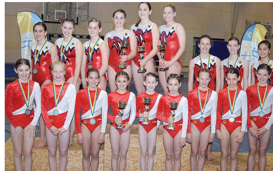
Vier von sechs Klassensiegen, zwei Silber- und vier Bronzemedailien gingen ans TSZ Dornbirn.

und TS Jahn Lustenau. Insgesamt hatten sich 144 Turnerinnen in 42 Vereinstams an den Meisterschaften beteiligt. Ein mit Beginn des Jahres völlig neu gestaltetes, österreichweit geltendes Turnprogramm, das Vereins- und Kaderturnerinnen gemeinsam wertet, sorgte für Spannung. In der kurzen Zeit von knapp drei Monaten gelang es den Turnerinnen ausgezeichnet, die neuen akrobatischen Teile, Ballettbewegungen und Sprünge der umgestalteten Übungen im Wettkampf umzusetzen.