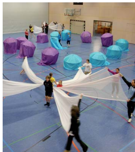
Gymnastrada-Probe für Lausanne: Die TS Mäder ist einer der 14 beteiligten Vereine.

Die Vorarlberger Turnerschaft gratuliert dem Verein und wünscht viel Erfolg anlässlich des Jubiläums!