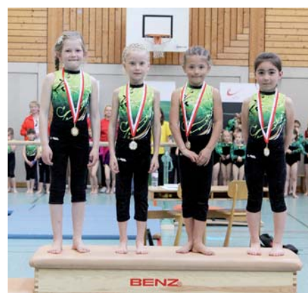
Mit 27 Teams war die AK8 die stärkste Klasse. Es gewann das Team der TS Dalaas.