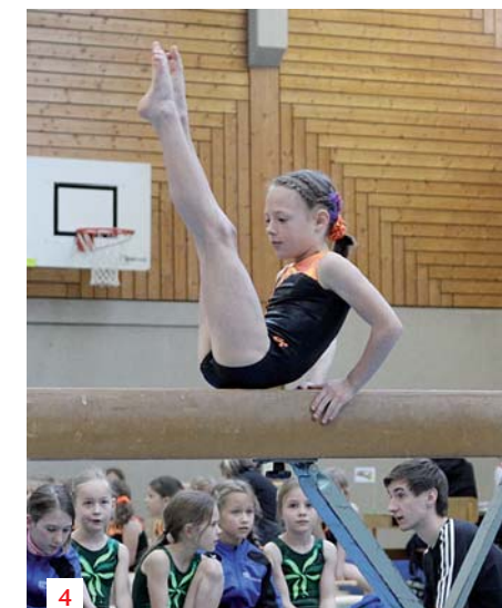
1 Die Sprünge am Minitrampolin zählen zu den beliebten Übungen der Turn10-Bewerbe. 2 Volle Konzentration bei der Übung am Reck. 3 Die Siegerinnen der Altersklasse 9 weiblich von der Sportgemeinschaft Götzis. 4 Den Großteil der Aktiven stellen die Mädchen. Besonders stark vertreten waren die Altersklassen AK 8 bis AK11.

Am 16. und 17. April wurden in der Wolfurter Hofsteigsporthalle die Vorarlberger Mannschaftsmeisterschaften in Turn10 mit 560 Aktiven ausgetragen.