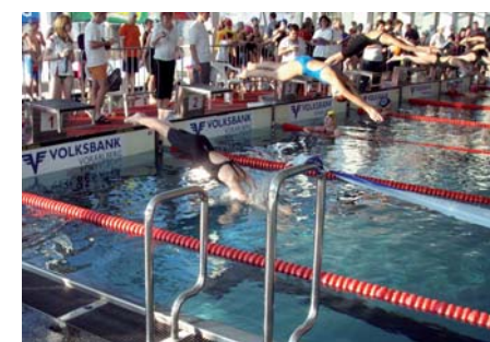
470 Schwimmer/innen waren am Start.